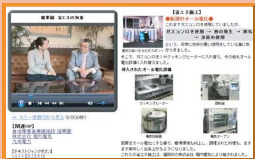
映像コンテンツ 参考イメージ